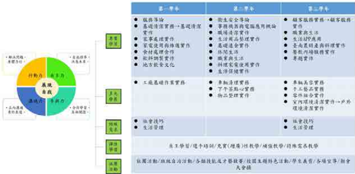
國立臺南特殊教育學校111學年度 餐飲服務科 課程地圖