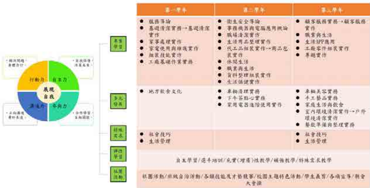
國立臺南特殊教育學校111學年度 綜合職能科 課程地圖